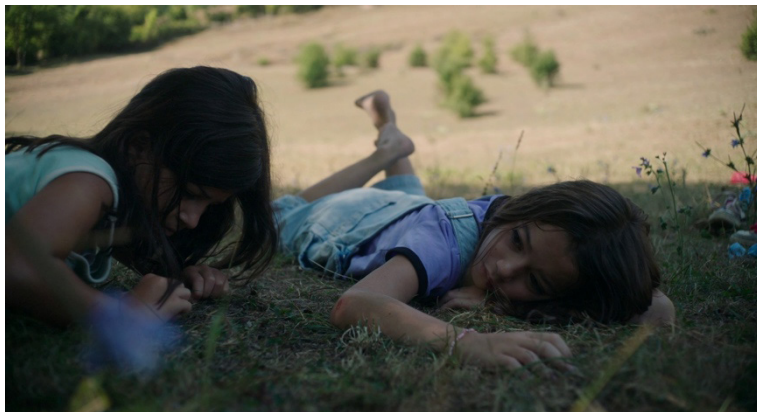
Figura 23. El cine español no retrocede ante la sexualidad infantil. 20.000 especies de abejas .