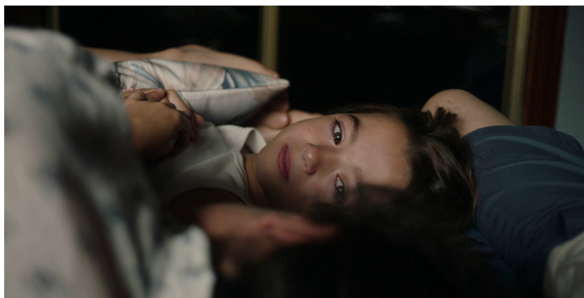
Figura 39. “Ama, ¿estás despierta?”. El final es una rima luminosa con el despertar angustioso del film

El último plano del film es una rima luminosa con aquel plano en el que Aitor no podía dormir. Lucía, rodeada de sus hermanos dormidos y su padre despierto, disgustado –que los ha visitado cumpliendo el deseo de Eneko– mira a su madre y con toda consciencia le pregunta: “Ama, ¿estás despierta?” (Figura 39). Una lágrima se asoma en sus brillantes ojos mientras sonríe en una mueca de complicidad. El plano final nos devuelve una pregunta sobre el nombre propio y el secreto de la hija.